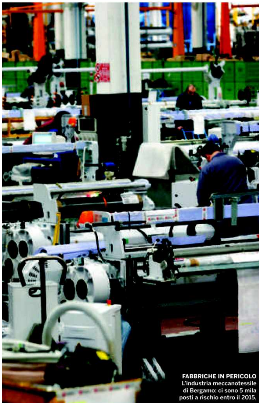
FABBRICHE IN PERICOLO L'industria meccanotessile di Bergamo: ci sono 5 mila posti a rischio entro il 2015.

te magari nella stessa fabbrica, è finita. Il futuro passa per una mobilità che viene alimentata dalle competenze.